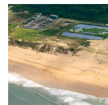
Station d'épuration en haut de dune