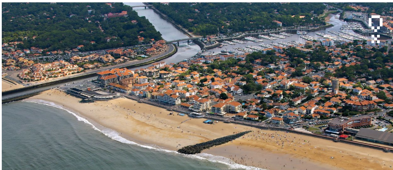
Front de mer de Capbreton